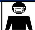
マスク着用の徹底