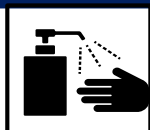
手洗い、手指消毒の徹底