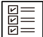
行動履歴、感染履歴の把握