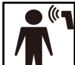
ツアー客、スタッフの検温の徹底